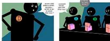
Mise en scène de situations critiques...

Il est constitué d'études de cas présentées sous forme de bandes dessinées qui alternent avec des exposés de synthèse associés à des exercices interactifs.